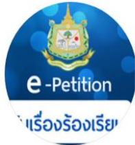
ช่องทางร้องเรียน