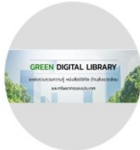
Green Digital Library Application