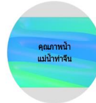
คุณภาพน้ำ